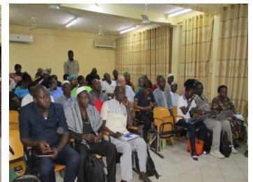
Conférence à Ouagadougou