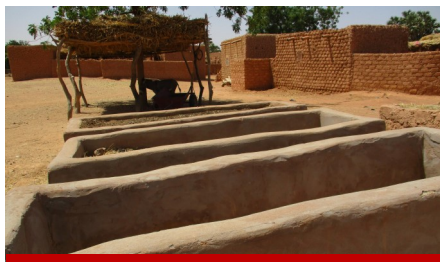
Les fosses fumières pour la production de fumure organique