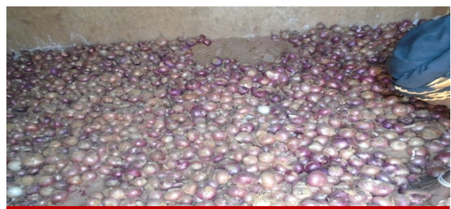
L'entreposage d'oignons de Awa Nampa/bénéficiaire