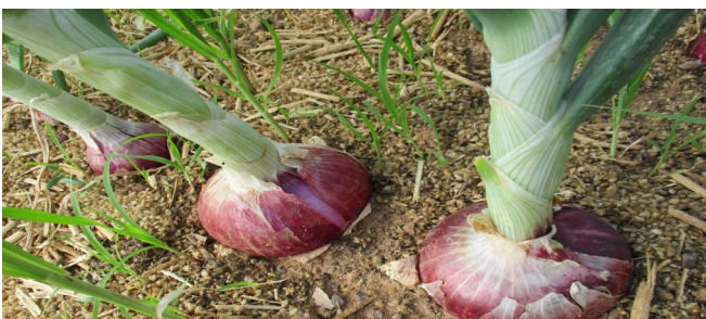
Les oignons presque à maturité