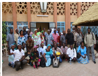
Photo de famille