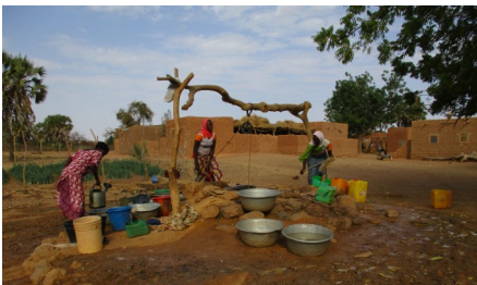
Les femmes puisent l'eau pour arroser le site maraîcher

Pour la campagne 2017-2018, le site maraîcher du village de Gargaboulé (dans le Soum) au nord du Burkina Faso, la moisson a été bonne. Les producteurs ont récolté 11 700 kilogrammes d'oignons. Cette expérience est au grand bonheur des habitants du village qui avaient peu d'espoir en leur terre aride.