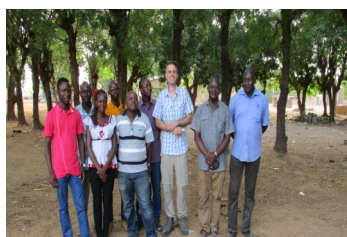
Débriefing à Toécé

Cette visite a été une occasion pour APN-Sahel et son partenaire local APASP (Association Pour La Promotion De l'Agro-Sylvo-Pastoral) basé Toécé, de présenter les différentes réalisations du programme dans le village de Binstigré.