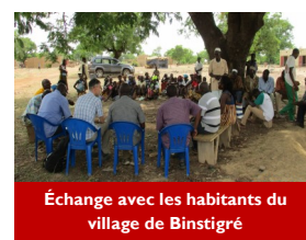
Échange avec les habitants du village de Binstigré