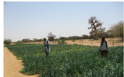
Le périmètre maraîcher

C'est une surface de 0,25 hectare qui a été consacrée à la production maraîchère à Gargaboulé, en cette campagne 2017-2018.