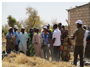
Visite à la ferme Yemboali

Deuxièmement, une conférence d'échange entre les participants et les agents de PNB BF, le 7 mars.